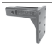
165 /166 Recibidor (pág. 47)

Es uno de los acopladores de Premier más singulares y versátiles. Nuestro modelo 150 es muy popular en aplicaciones para Pickups, y Camionetas . El 150 es utilizado para arrastrar un remolque con conexión de ojo o de bola, su seguro de giro-lateral patentado ayuda a prevenir daño en la parte trasera y mantiene un perfil compacto.